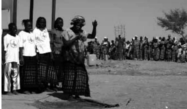
Eine Beschneiderin wirft ihr Messer weg - Theaterstück gegen FGM

«Ich bin sprachlos, traurig, wütend, dass Frauen und Mädchen an ihren Genitalien verstümmelt werden – und dass es auch in der Schweiz geschieht. Was kann ich tun?»