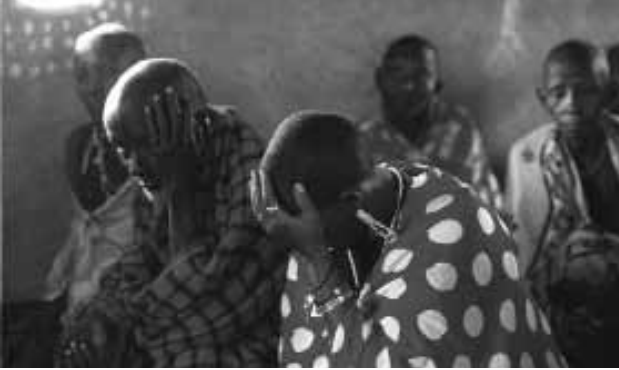
Aufklärungsveranstaltung von CAFGEM Kenia

Eltern lassen bei ihren Kindern in guter Absicht FGM durchführen. Eine Frau, deren äusseren Genitalien nicht weggeschnitten sind, wird diskriminiert, als heiratsunfähig betrachtet und aus der Gemeinschaft ausgestossen.