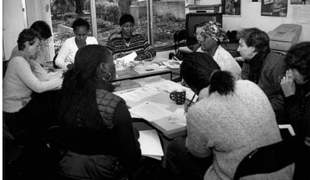
Präventionsprojekte von MigrantInnen für MigrantInnen sind wichtig

Nach Schätzungen von UNICEF leben in der Schweiz 6'000 bis 7'000 Frauen und Mädchen, die von der weiblichen Genitalverstümmelung betroffen oder bedroht sind.