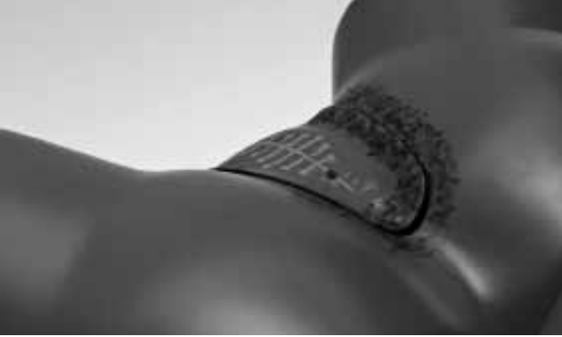
Plastikmodell zur Aufklärung über körperliche Folgen von FGM

Bei der weiblichen Genitalverstümmelung wird ein gesundes Organ weggeschnitten. Dies kann nicht wieder rückgängig gemacht werden und hat schwerwiegende körperliche Folgen für die Betroffenen.