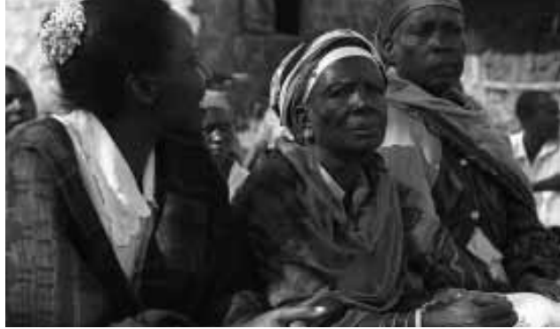
Ehemalige Beschneiderinnen in Kenia

Ausgeführt wird Genitalverstümmelung meist von älteren Frauen, die ihren Beruf oft von der Mutter übernommen haben. Je nach Region üben professionelle Beschneiderinnen, Geburtshelferinnen oder auch Barbieri und Mediziner diese traditionsgemäß hoch angesehene Tätigkeit aus. Da sie für die Genitalverstümmelungen bezahlt werden, verfügen sie über ein eigenes Einkommen und über einen hohen Status in der Gesellschaft.